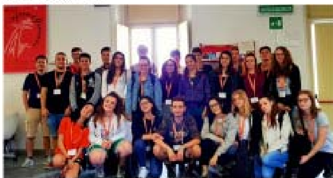
Lunedì 11 giugno

Il Comune di Collegno ha accolto e avviato l'esperienza di Alternanza Scuola Lavoro di 25 studenti e studentesse delle Scuole Secondarie di II grado. Il loro tirocinio formativo, attraverso il Progetto Qualcosa in Comune, avrà una durata di quattro settimane e si svolgerà all'interno di Uffici Comunali, Associazioni, Cooperative sociali e Scuole del territorio.