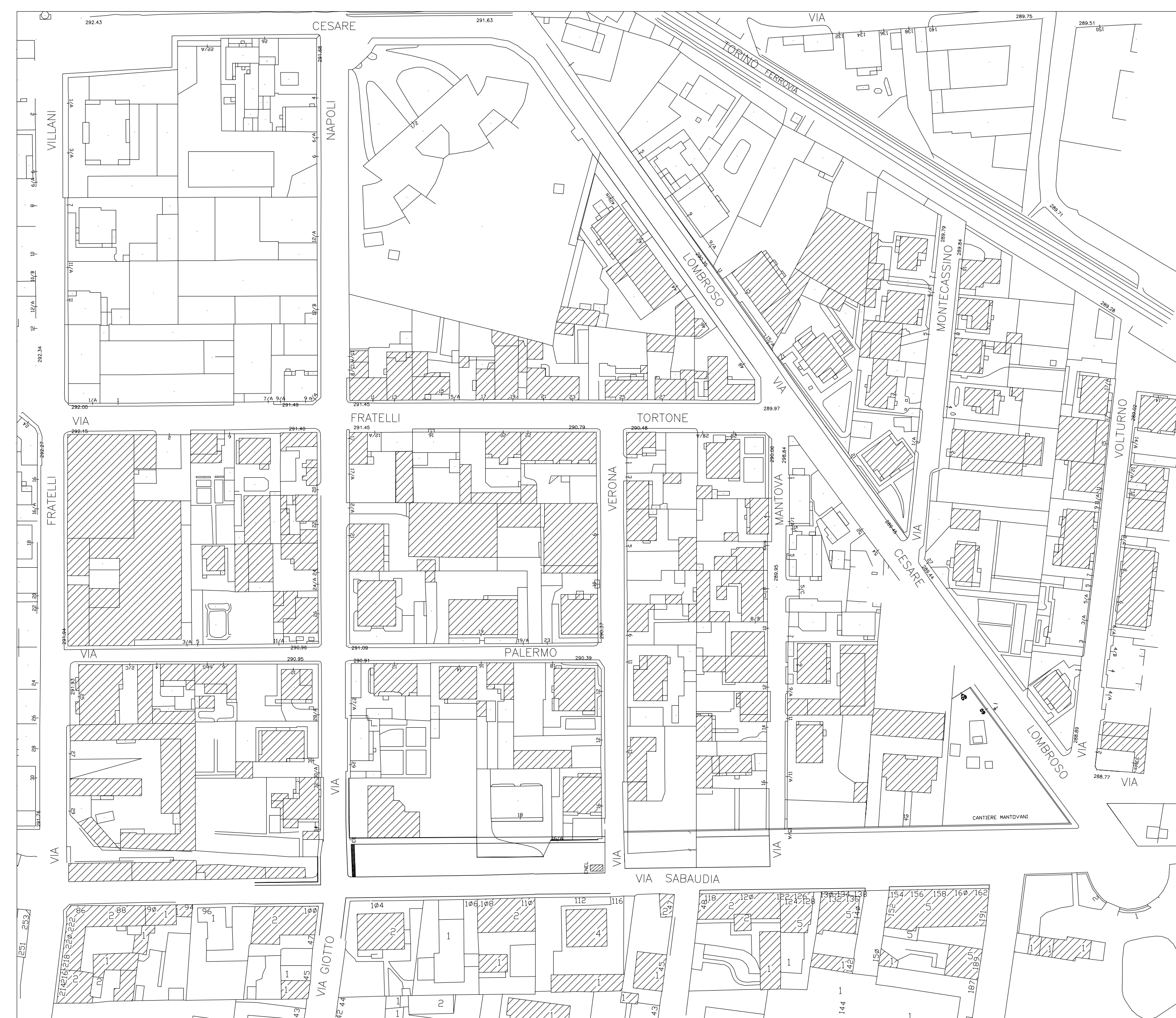
PLANIMETRIA GENERALE ZONA DI INTERVENTO scala 1:1000

PROGETTISTA Arch. AIME Roberta Arch. RINARELLI Valerina COLLABORATORI IL RESPONSABILE DEL PROCEDIMENTO Ing. TEMPO S.