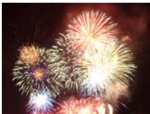
1 giugno 2011: fuochi d'artificio in piazza del Municipio