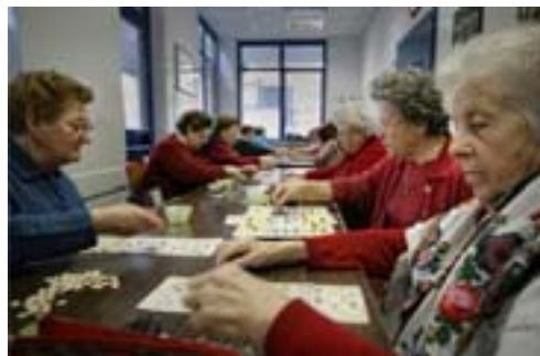
Estate Sicura 2010