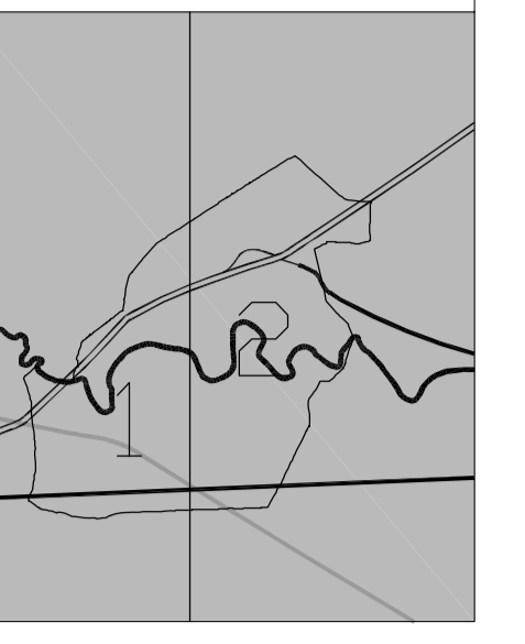
Tavola approvata con deliberazione del Consiglio Comunale n. .... del .....

con modifiche ex art. 17, comma 8, L.r. 56/77 e s.m.i. connesse alla Variante al P.P. "Area ELBI"