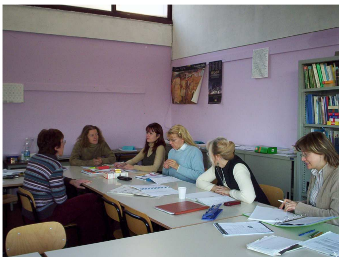
Studio approfondito della lingua italiana per la preparazione dell'esame CILS dell'Università di Siena