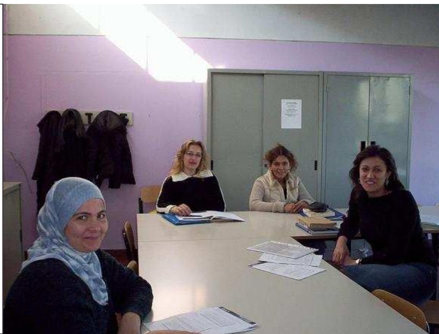
Momento di studio e confronto fra culture diverse