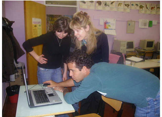
Un momento di ricerca di gruppo nell'ambito del corso di italiano per stranieri

Corso di licenza media Percorsi differenziati anche in favore delle madri-studentesse