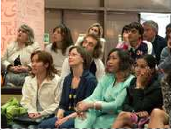
Fiera Internazionale del Libro di Torino: premiazione del concorso "Lingua Madre Duemilaotto" Primo premio giuria popolare ad un'allieva del C.T.P.