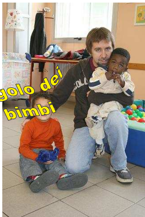
Bambini ed educatore della Cooperativa Atypica nel baby parking della scuola

Un corso di italiano per madri straniere,